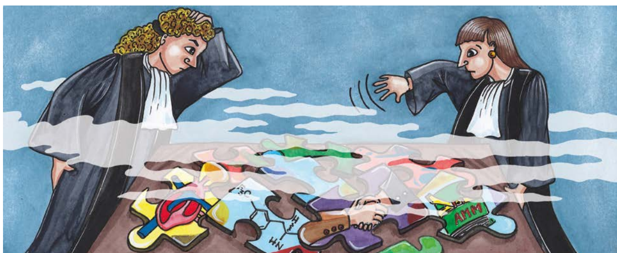
Illustration : Léa Lord