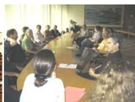
Les Rencontres de Rennes 2008