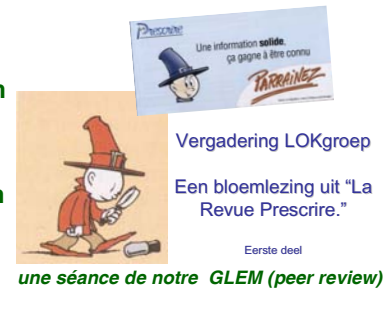
une séance de notre GLEM (peer review)

Pour notre Groupe Local d'Evaluation Médicale, j'ai présenté les idées de Prescrire.