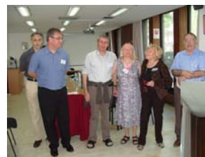
PARIS 2009 La journée des adhérents