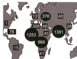
Taux de prévalence des principales affections (taux pour 1000 personnes, Comede 2001-2008 sur 18 996 personnes ayant consulté, IFR/SOMS, 2006, prévalences plus élevées pour les femmes et les hommes)